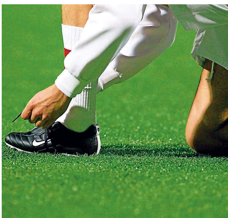
Für die meisten Saarfußballer heißt es am Wochenende noch einmal die Schuhe schnüren. Manche müssen aber auch „nachsitzen“.

Bezirksliga Saarbrücken: Vorne stehen die punktgleichen FV Püttlingen und SC Bliersbach. Am kommenden Sonntag spielt Püttlingen zu Hause gegen Schlusslicht SF Köllerbach II, Bliersbach spielt beim SV Klarenthal II. Vorausgesetzt, beide holen in diesem Fernduell die gleiche Anzahl an Punkten, dann gibt es am 28. Mai um 19 Uhr in Gündingen ein Entscheidungsspiel um die Meisterschaft. Der Verlierer dieses Spiels kann noch über eine Relegationsrunde gegen die Vize-Meister der Bezirksligen Saarlouis (SV Hülzweiler